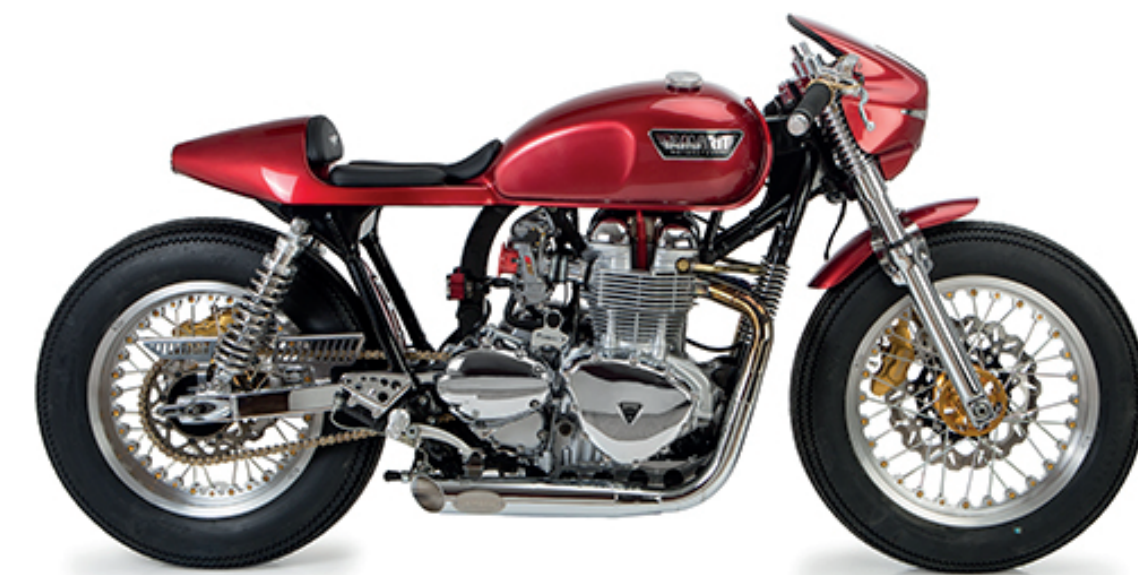
Gullwing X 39.900€